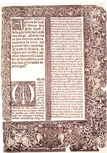
Pàgina manuscrita de Tirant lo Blanc .